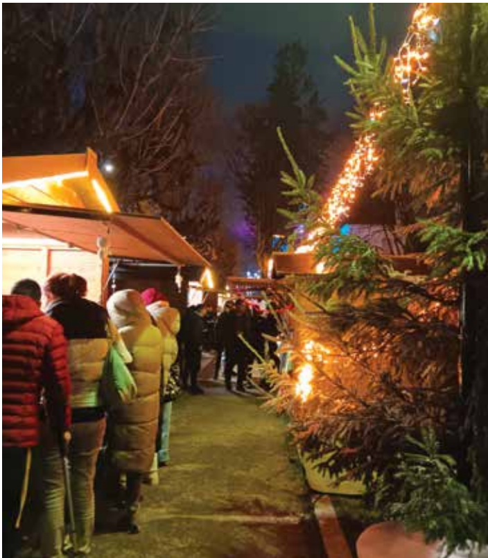
Pendant tout le week-end les chalets proposaient leurs stands aux Villeneuvois.