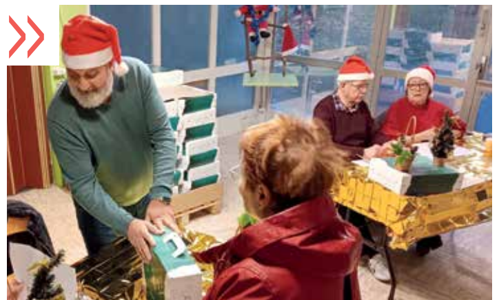
Distribution des colis de Noël pour les seniors de Villeneuve-Saint-Georges