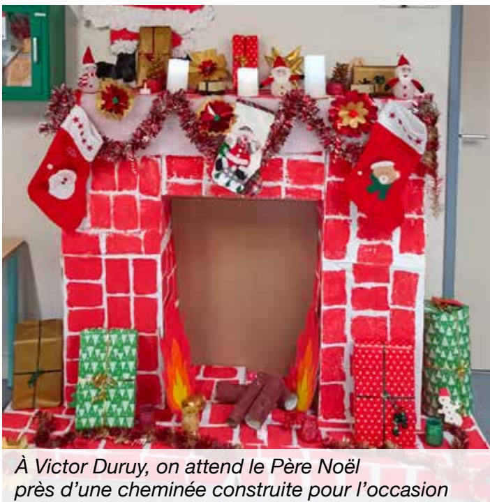
À Victor Duruy, on attend le Père Noël près d'une cheminée construite pour l'occasion