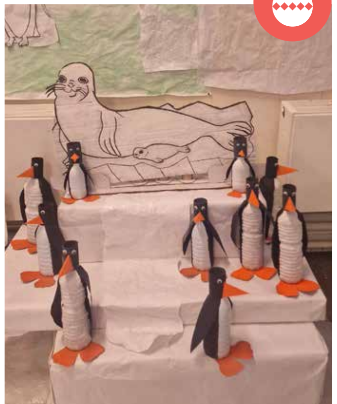
Magnifique banquise de l'école Jean de La Fontaine