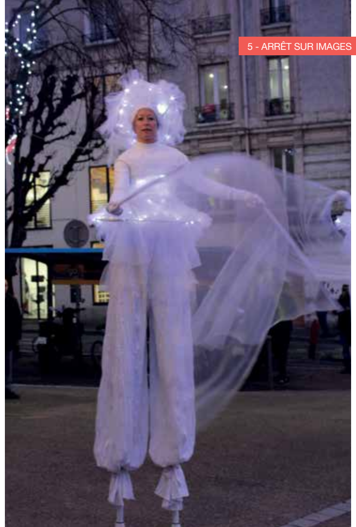
Les « Fées lumineuses » ont fait une apparition le vendredi soir, juchées sur leurs échasses.