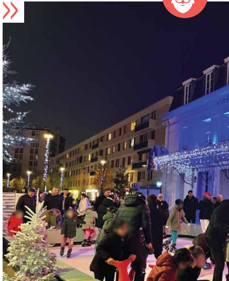
Pendant plusieurs jours, les familles ont pu s'essayer à la glisse sur la première patinoire éphémère de Villeneuve-Saint-Georges.

Du vendredi 15 au dimanche 17 décembre, les Villeneuvois ont pu découvrir l'ambiance féérique du village de Noël pour sa quatrième édition. Différents stands étaient ouverts au public : vin chaud, fabrications artisanales, maquillage, jeux de société en bois, vêtements de saison, confiseries de Noël, parfums... Le père Noël était également présent et proposait de prendre des photos avec les Villeneuvois, petits ou grands. Le vendredi soir, les membres de l'association « Fées lumineuses » ont fait une parade de lumière sur échasses. Le lendemain, l'association Vox Libre a donné un concert de chants de Noël. Enfin, le dimanche, les Villeneuvois ont pu assister au spectacle « Les énigmes de Noël ». Pendant toute la durée du marché, et jusqu'au 20 décembre, une patinoire éphémère placée devant la mairie a permis aux familles et aux amis de partager les joies de la glisse sous les illuminations de Noël.