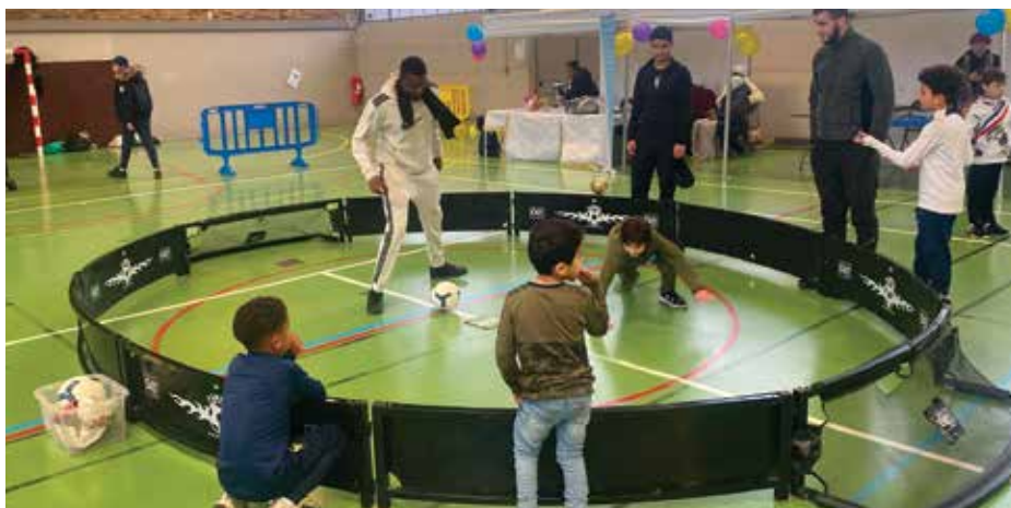
Les jeunes Villeneuvois ont également pu s'essayer au football freestyle

Cette année, plusieurs événements étaient organisés pour le Téléthon. Le 8 décembre, 800 élèves de l'école Condorcet, de la petite section au CM2 ont effectué une course solidaire au profit de l'AFM-Téléthon grâce aux dons d'entreprises et de parents solidaires. Ils se sont relayés pendant toute la journée afin d'atteindre 2 000 km de distance.