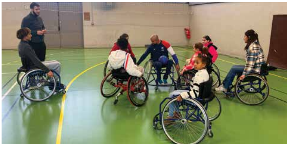
Partie de basket fauteuil pendant l'événement Handi'Festi