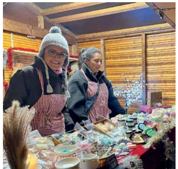
Le stand « Candela » a présenté ses étales de bougies parfumées, produites à base de cire végétale et respectueuses de l'environnement