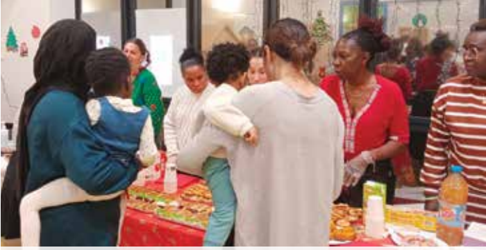
Goûter de Noël à la Maison de la Petite Enfance