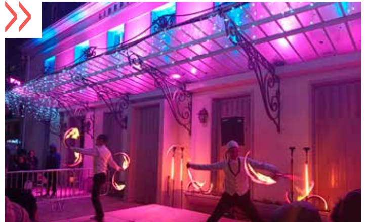
Lancement des illuminations de Noël avec le spectacle de Led Show.