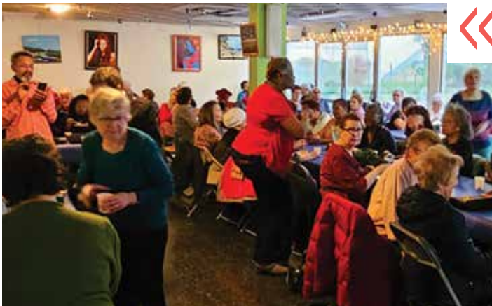
Ambiance festive à la résidence des seniors pour le repas de fin d'année