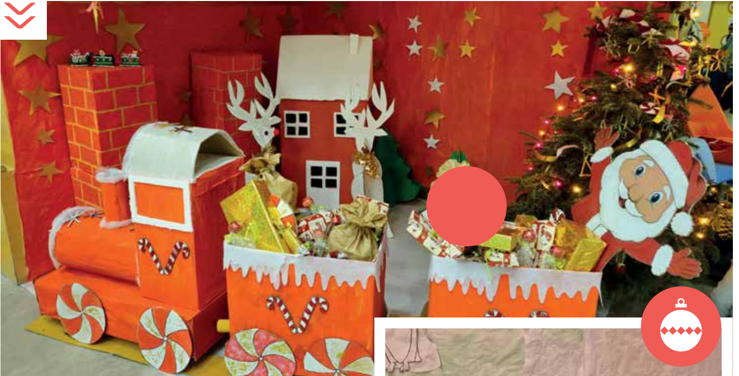
Petit train chargé de cadeaux, confectionné par les élèves d'Anne Sylvestre

Cette année, les accueils périscolaires ont enchanté les écoles avec des décorations de Noël aussi diverses que variées : forêt de sapins enneigés à Victor Duruy, boîte aux lettres pour le Père Noël à Marc Seguin, fresque du Pays imaginaire à Paul Vaillant Couturier, petit train chargé de cadeaux à Anne Sylvestre, sapin de cintres à Berthelot, orné de boules et de guirlandes à Jean Zay, ou encore un renne confectionné à base de bûches de bois à Condorcet.