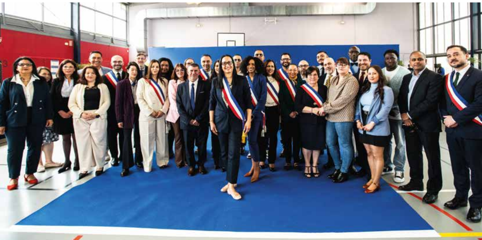
La nouvelle équipe municipale élue le 15 mars 2026