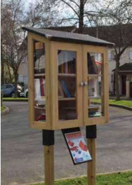
Boîte à livres, Boulevard de la Paix