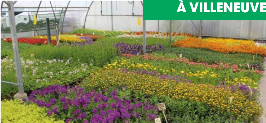
Les Serres municipales

Le service municipal des Espaces verts mène régulièrement des campagnes de plantation d'arbres et de végétaux dans la Ville, notamment dans les écoles et les espaces verts. La Ville dispose également d'une serre municipale, qui ouvre ses portes au public lors de la Fête de l'environnement au mois de mai. Elle accueille aussi de nombreuses visites pédagogiques.