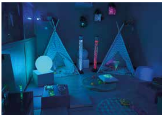
Salle zen à l'école Anatole France

Dans cette même dynamique, une première « Salle Zen » a été inaugurée en février. Cet espace a pour but d'offrir aux enfants un environnement calme et apaisant. Les élèves peuvent y apprendre à se détendre, mieux gérer leurs émotions et retrouver un cadre rassurant au sein de l'école. Par ailleurs, le Pôle Famille a mis en place le dispositif « Sport Adapté », une initiative sportive destinée aux enfants en situation de handicap. Les séances sont proposées les mercredis et durant les vacances scolaires.