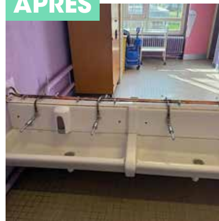
Pose de lavabos neufs à l'école Saint Exupéry