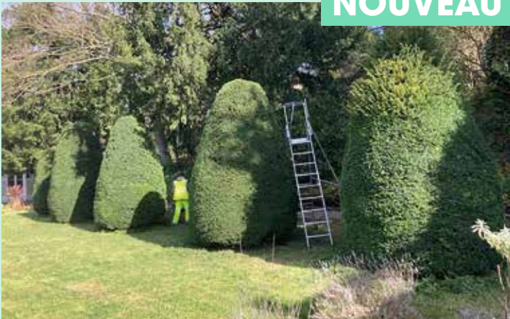
Taille des arbres du conservatoire