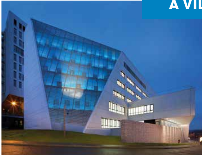
Centre hospitalier intercommunal