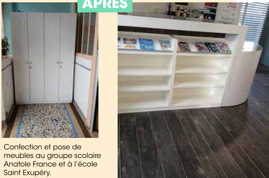
Confection et pose de meubles au groupe scolaire Anatole France et à l'école Saint Exupéry.