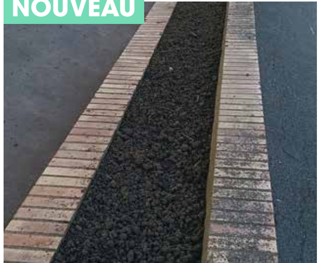
Plantation de semi gazon fleuri