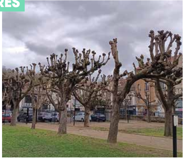
Élagage du parc Brassens