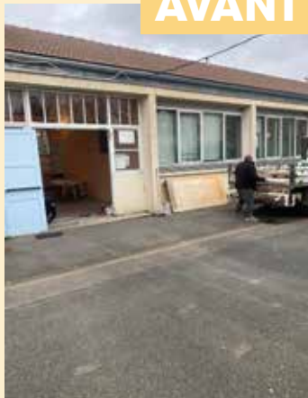
Nouvelles portes et vitres à l'école Condorcet.