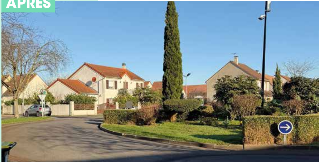
Nettoyage de la place Jean Monnet