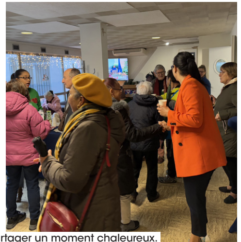
Buffet convivial pour partager un moment chaleureux.