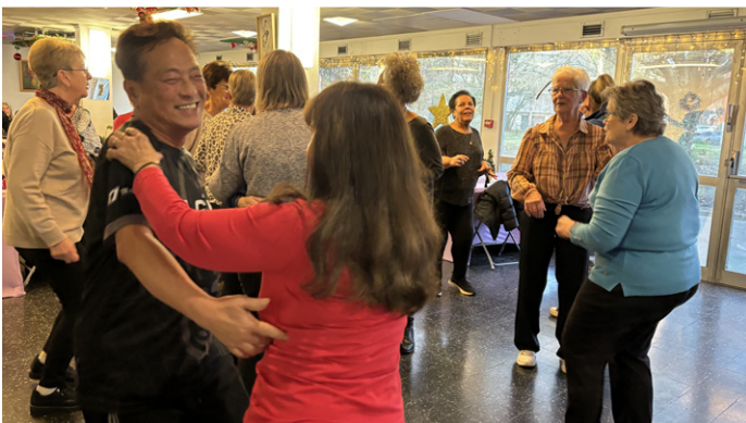
Les Seniors ont dansé en rythme pour fêter Noël.