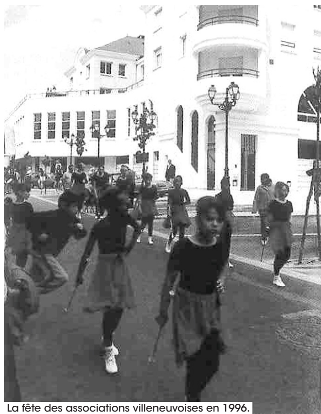
La fête des associations villeneuvoises en 1996.