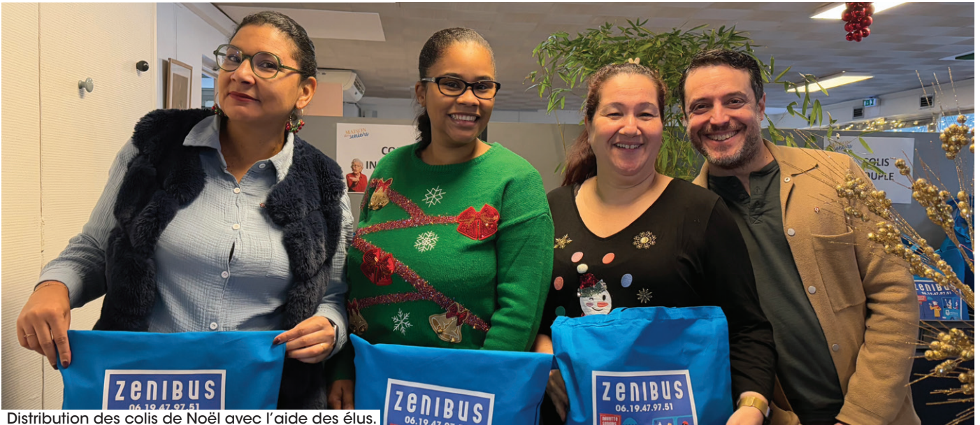
Distribution des colis de Noël avec l'aide des élus.