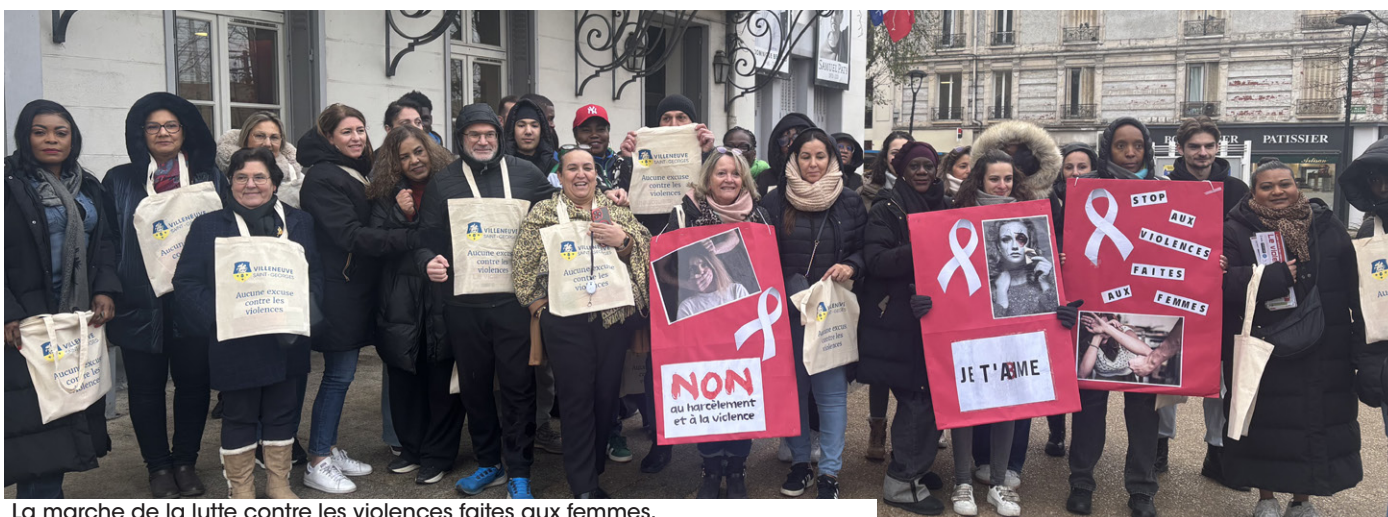
La marche de la lutte contre les violences faites aux femmes.