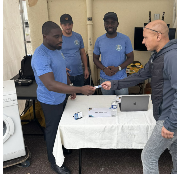
Pour rejoindre l'association Culture Repair : repairculture00@gmail.com