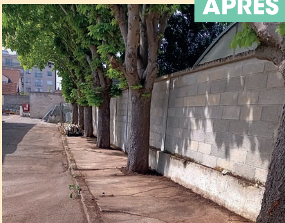
Nettoyage des rues et des espaces verts