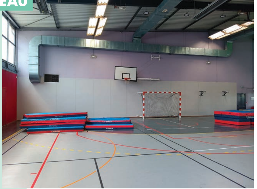
Poursuite des travaux de rénovation dans nos équipements sportifs.