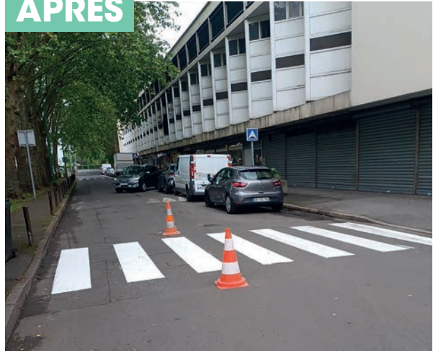
Poursuite du programme de remise en peinture des marquages au sol en Ville, création de places handicapés et de places « arrêt minute »