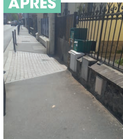
Retrait des dépôts sauvages