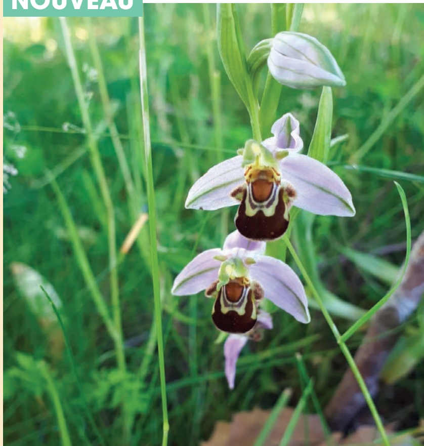
Des orchidées abeille sauvages poussent désormais dans le square de l'Europe, grâce à la gestion des services municipaux.