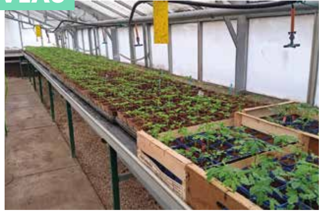
Ça pousse dans nos serres municipales !