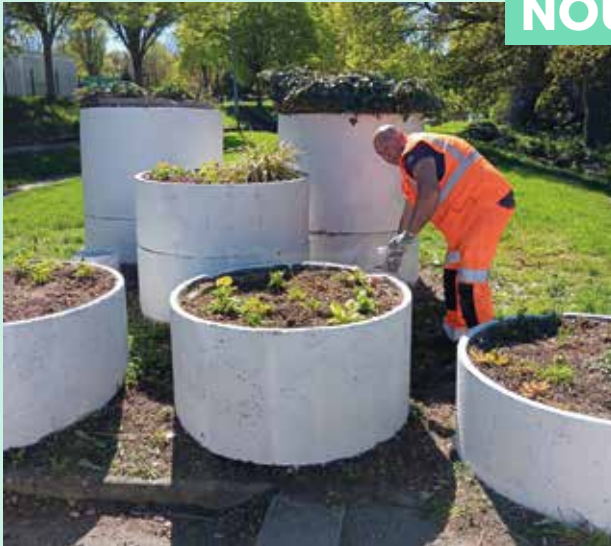
Travaux de fleurissement et de remise en peinture