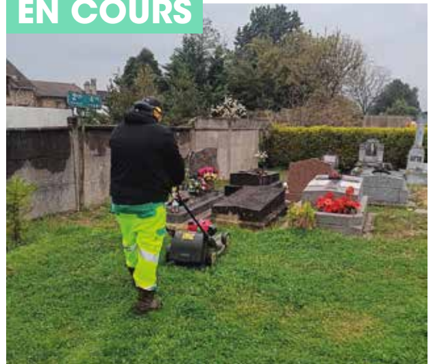
Entretien du cimetière