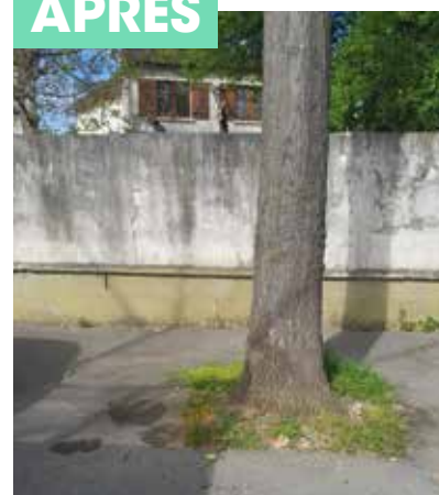
Opération de nettoyage des rues