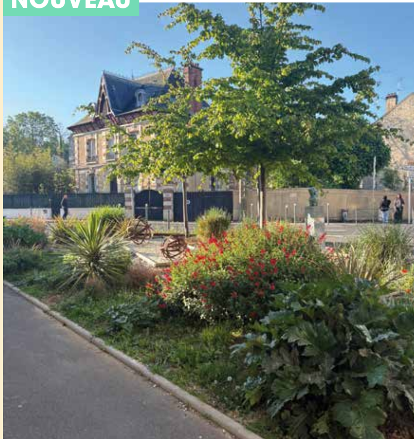
Fleurissement de la Ville