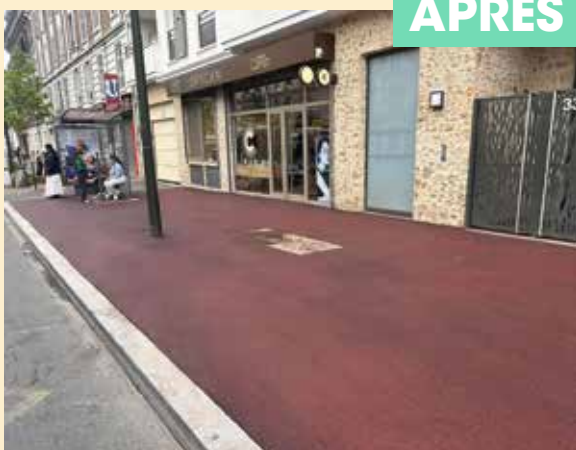
Trottoirs rénovés avenue Carnot