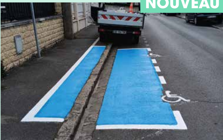
Création de places PMR (personnes à mobilité réduite)