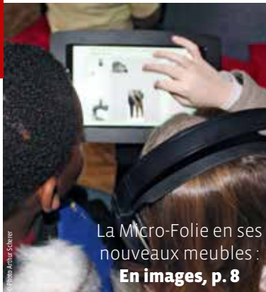
La Micro-Folie en ses nouveaux meubles : En images, p. 8