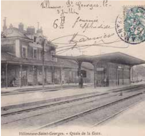
Villeneuve-Saint-Georges. - Quais de la Gare.