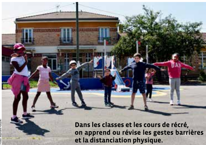
Dans les classes et les cours de récré, on apprend ou révise les gestes barrières et la distanciation physique.