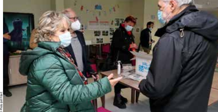
Première distribution de masques à la résidence Marianne, le 11 mai dernier.

LE MASQUE N'EST PAS UNE PROTECTION ABSOLUE ! Il doit s'accompagner du respect des gestes barrières et de la distanciation physique, et être correctement utilisé et renouvelé : reportez-vous aux consignes d'utilisation. ■